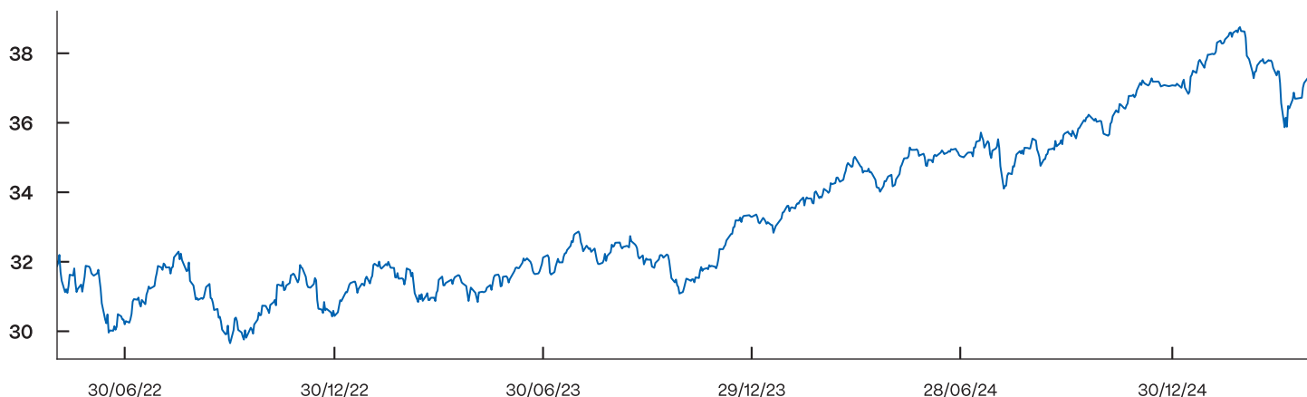
Grafico performance cumulata a 3 anni

Aprile 2025 è stato segnato da forte volatilità sui mercati azionari, innescata dall'introduzione di dazi reciproci voluti da Donald Trump per riequilibrare la bilancia commerciale USA. Dopo il "Liberation Day", si sono registrate vendite diffuse e cali marcati su tutti i principali indici globali, alimentando i timori di recessione negli Stati Uniti, con una probabilità stimata oltre il 50%. In questo contesto, il fondo ha chiuso il mese con una performance vicina allo 0%, penalizzato dalla correzione dei mercati americani ed europei, ma ha contenuto le perdite grazie alla ridotta esposizione al dollaro.