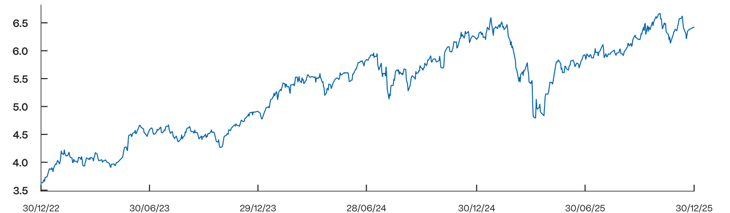
Grafico performance cumulata a 3 anni